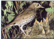
Κελαϊδότσιλα (Τσίχλα η κοινή)