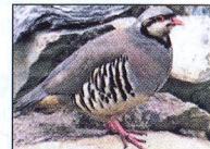
Νησιωτική Πέρδικα (Τσούκαρ)